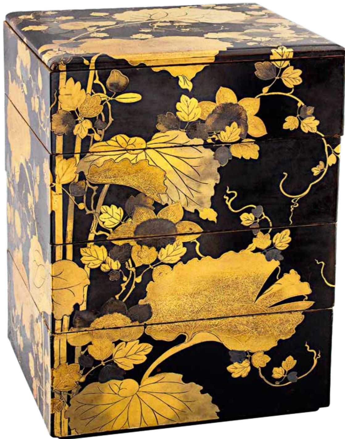
Коробка для пикника XX век. Япония Дерево, лак; роспись 24 × 24 × 32 ГОСУДАРСТВЕННЫЙ МУЗЕЙ ВОСТОКА