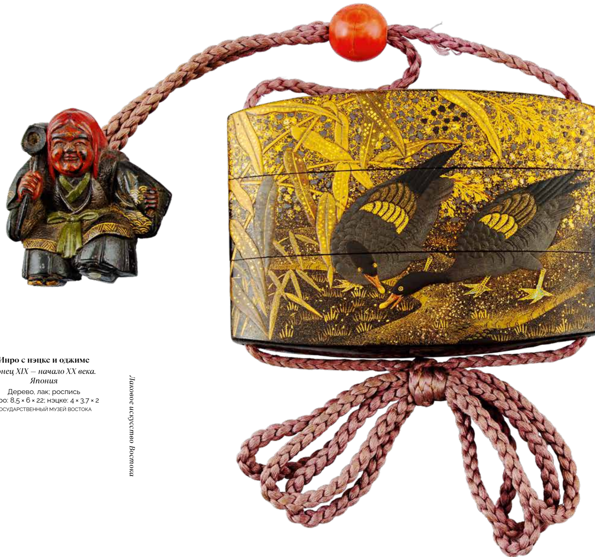
Инро с нэцке и оджике Конец XIX — начало XX века. Япония

Персидские лаки по технологии изготовления предметов напоминают индийские кашмирские изделия, но отличаются неистощимым разнообразием орнамента, нежностью колорита, близостью к книжной иранской миниатюре. В Персии для изготовления лака использовали сандарак (красный мышьяк), который получали из смол хвойных деревьев семейства кипарисовых тетраклинис членистый ( Netraclinis articulata ).