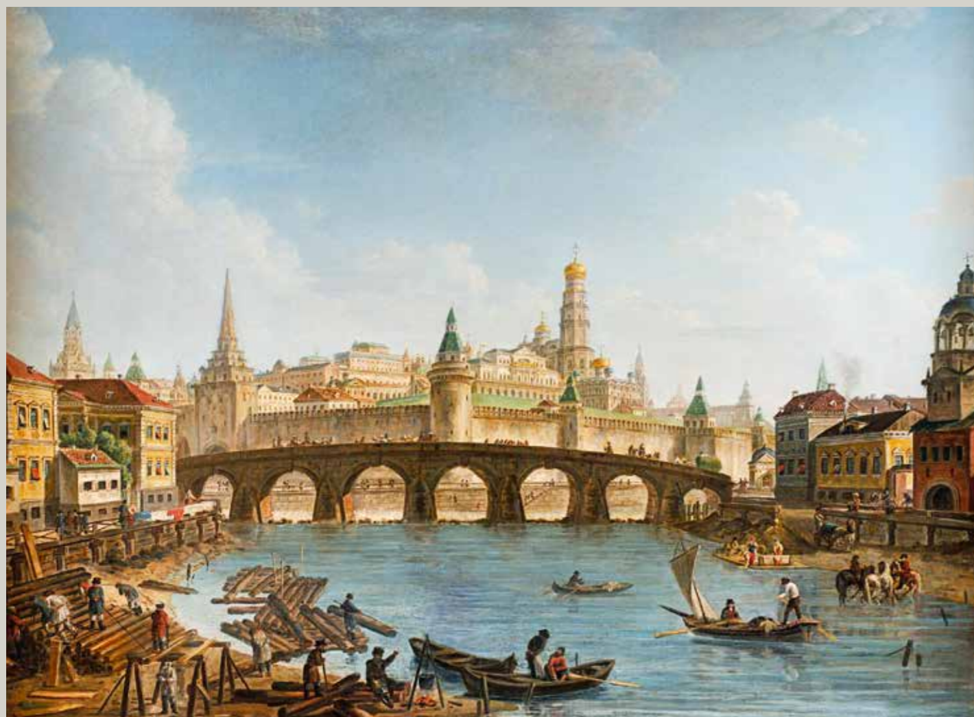
Алексеев Федор Яковлевич Вид Московского Кремля и Каменного моста

Начало XIX века Музеи Московского Кремля Кат. 189