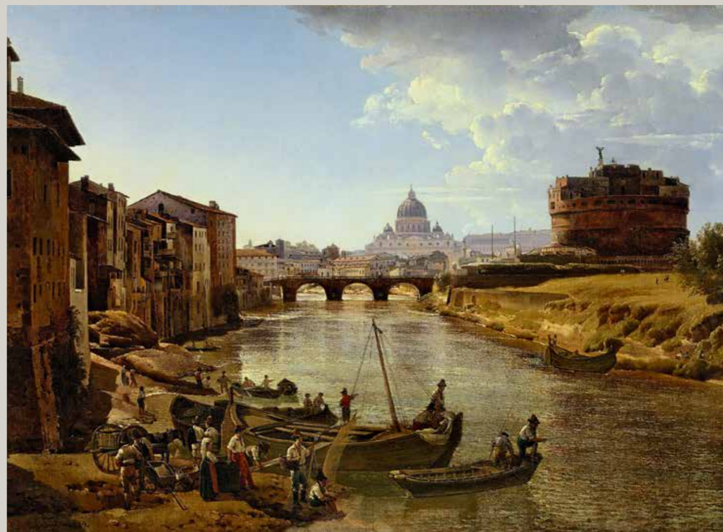
Щедрин Сильвестр Феодосиевич Новый Рим. Замок Святого Ангела

Early 19th century Moscow Kremlin Museums