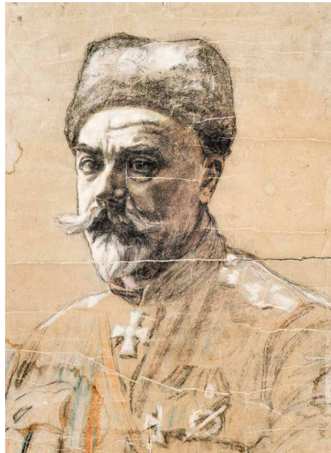
Неизвестный художник Портрет генерала А. И. Деникина (Кат. 144)

На выставке представлены документы и личные вещи А. А. Брусилова, А. И. Деникина и А. В. Колчака из состава трех комплексов — РЗИА, материалов, собранных АОР в 1920–1930-х годах, и из последних поступлений.