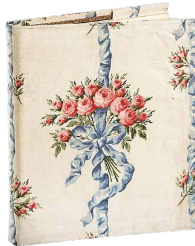
Записная книжка императрицы Александры Федоровны со стихотворениями и выписками из философских и религиозных сочинений 1915–1918 (Кат. 92)