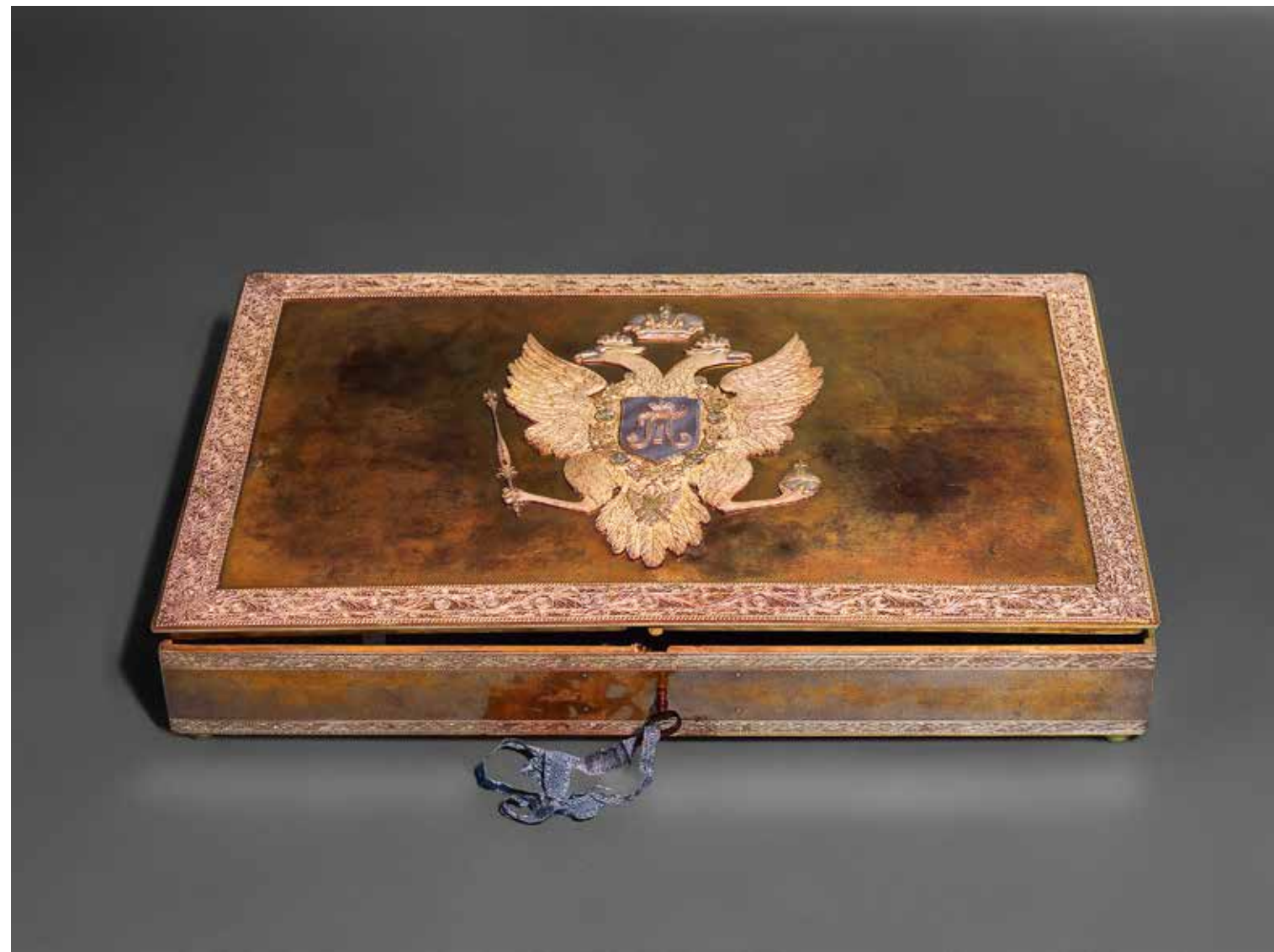
Ларец для хранения Акта о престолонаследии Санкт-Петербург. 1797 (Кат. 5)

К концу XIX столетия в ларце оказалось сосредоточено семь документов. В 1880 году по распоряжению Александра II ларец вместе со всем его содержимым был переправлен в Петербург в Государственный архив Российской империи. В 1920-е годы ларец и лежавшие в нем документы снова вернулись в Москву.