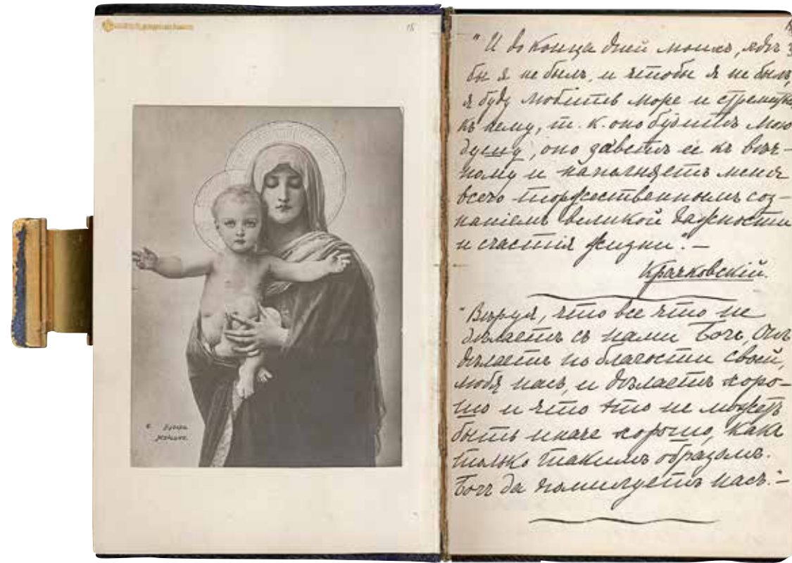
Записная книжка императрицы Александры Федоровны с переписанными стихотворениями 1901 (Кат. 91)