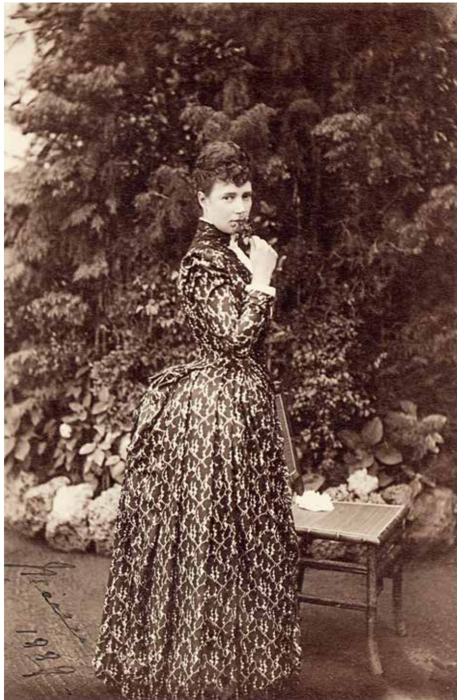
Императрица Мария Федоровна 1889 (Кат. 66)