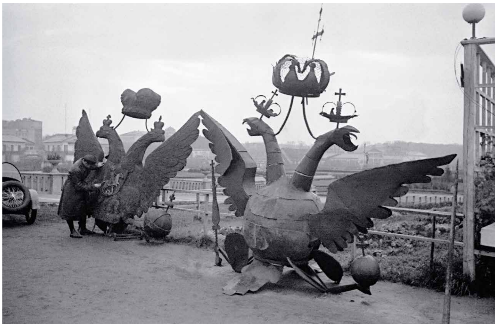
Гербовые орлы Российской империи, снятые со шпилей башен Московского Кремля, в Центральном парке культуры и отдыха имени М. Горького