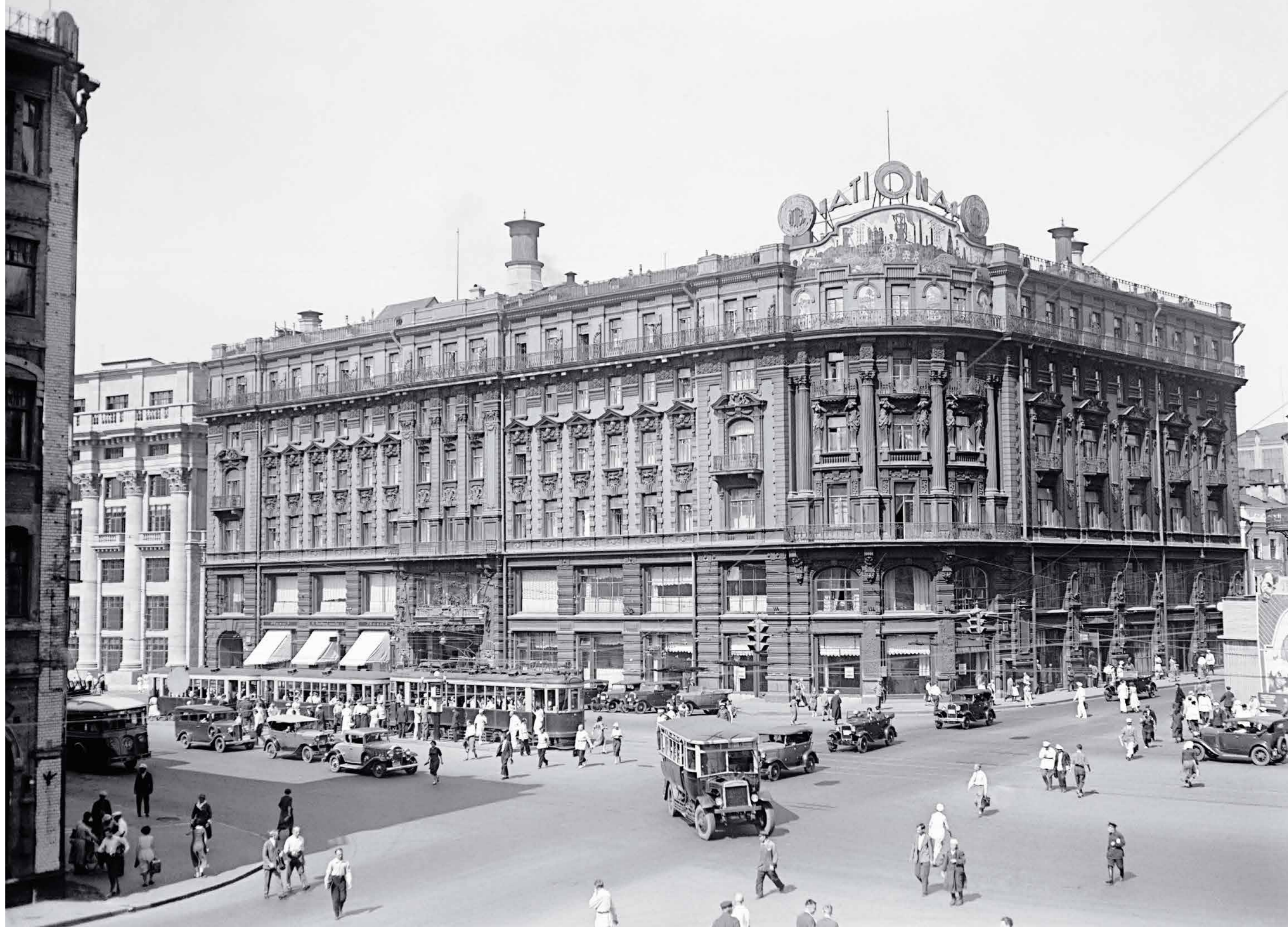
Гостиница «Националь» на Моховой улице 1935 2-78889