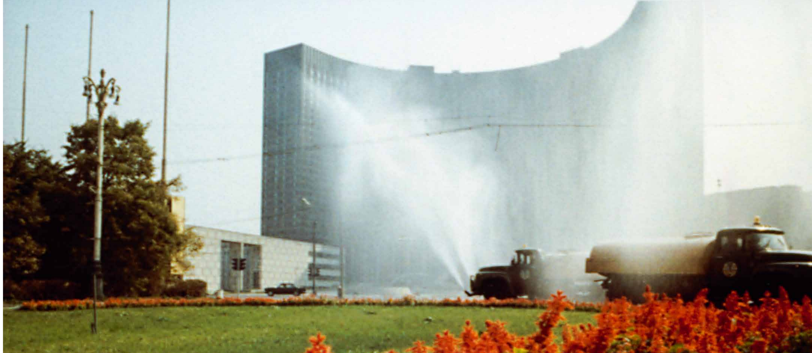
В одном из парков 1983 33974