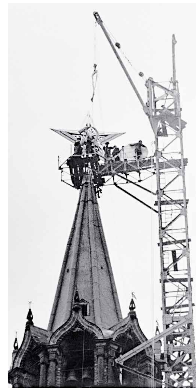
Работы по установке звезды на Спасной башне Московского Кремля взамен гербового орла Российской империи