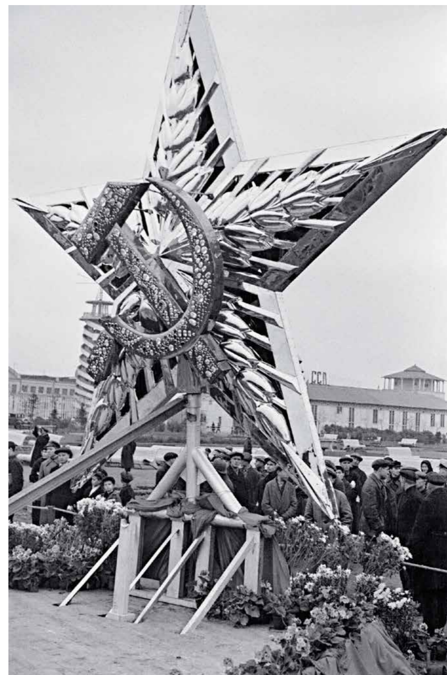
Одна из пятиконечных звезд, изготовленных из нержавеющей стали и красной меди с золотым покрытием и драгоценными камнями для шпилей башен Московского Кремля взамен гербовых орлов Российской империи, на выставке в Центральном парке культуры и отдыха имени М. Горького