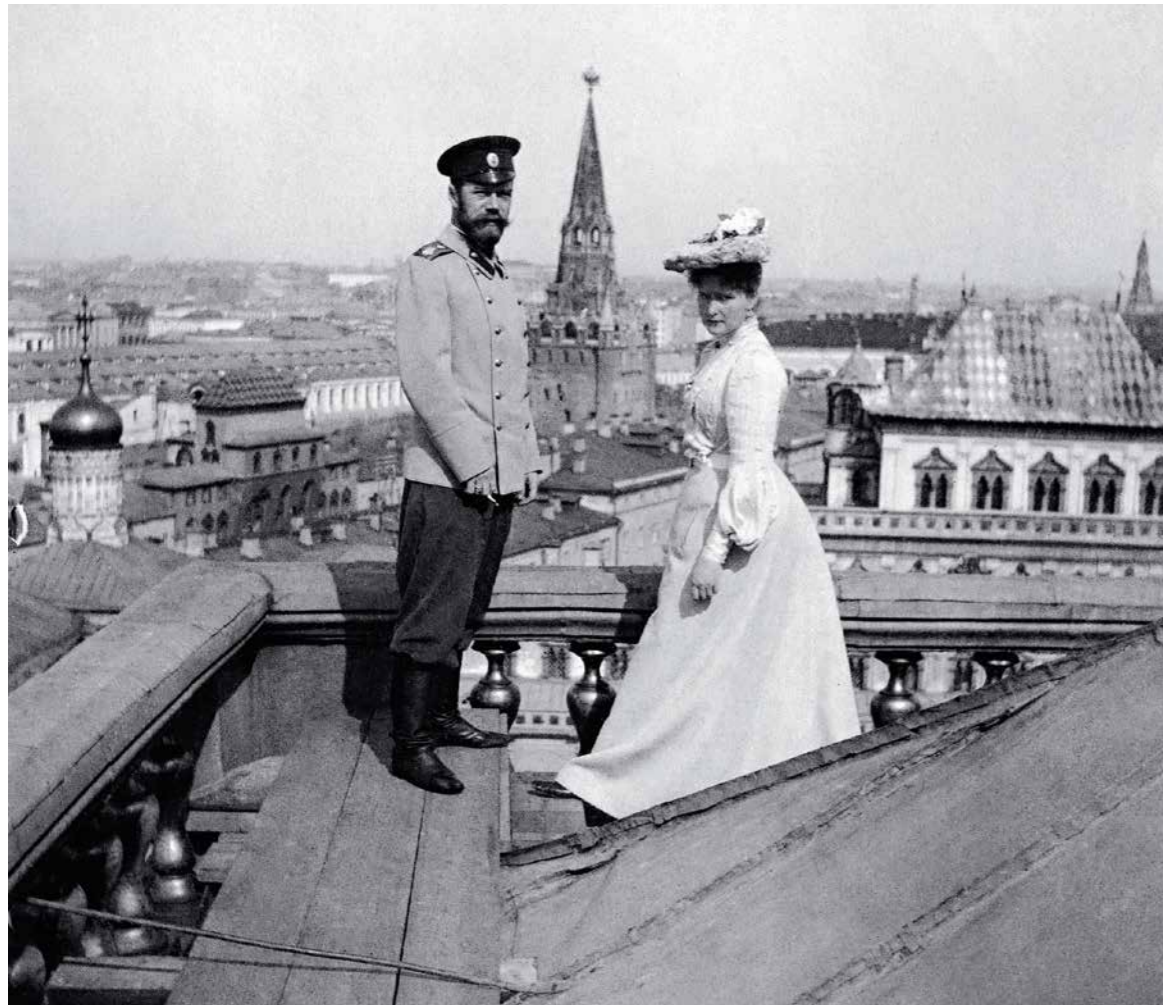
Император Николай II и императрица Александра Федоровна на крыше Большого Кремлевского дворца 1903